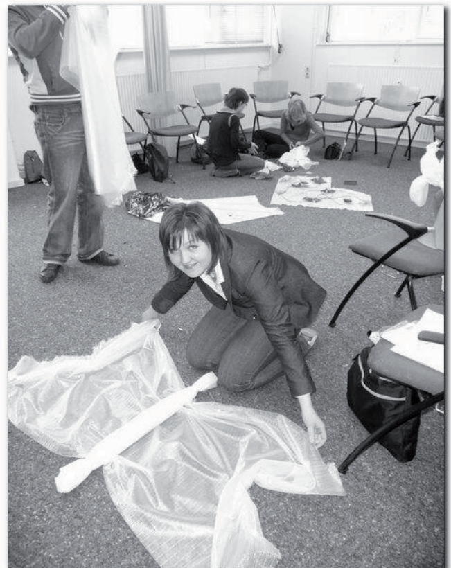
Workshop "Kinderen en hun beeldtaal"

En het einde van het verhaal van de mier en de eek-